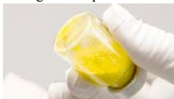
Reconstituire incompletă: particule vizibile