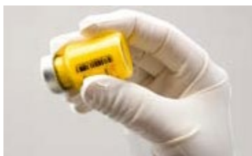
Figura C: Se agită ferm flaconul

Dacă se formează spumă, flaconul se lasă să stea pentru a permite disiparea spumei. Dacă medicamentul nu este utilizat imediat, se va agita puternic pentru refacerea suspensiei. Suspensia reconstituită de ZYPADHERA rămâne stabilă în flacon timp de până la 24 ore.