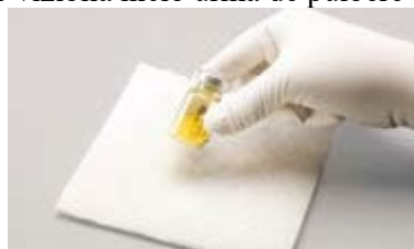
Figura A: Agitați ferm pentru amestecare