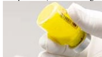
Reconstituire completă: fără particule vizibile

Figura B: Se va verifica pentru existența pulberii neînglobate în suspensie și se va agita din nou dacă este cazul